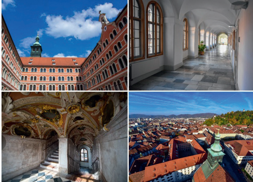
Priesterseminar Graz