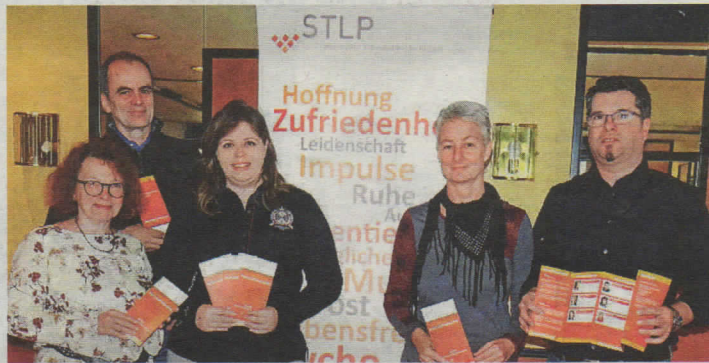
Die regionalen Psychotherapeuten mit ihrem Folder

Aus diesen Gründen betont Gesundheitslandesrat Christopher Drexler, dass die Zukunft des LKH-Standortes Mürzzuschlag gesichert sei, „soweit die Planungshorizonte reichen“.